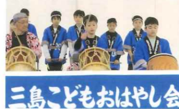
三島子どもおはやし会