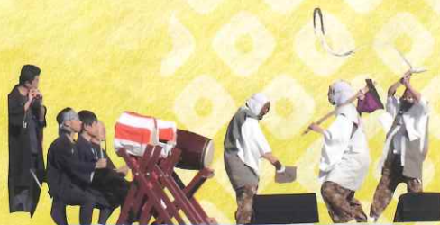
大田原市 中野内太々神楽保存会