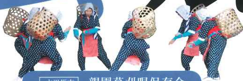
大田原市 親園草刈唄保存会