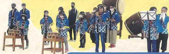
那須塩原市 埼玉子供おはやし会