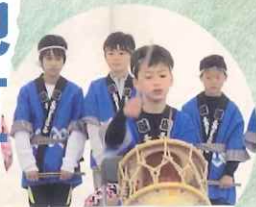
那須塩原市 三島おはやし会、